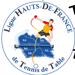
Tableau B (plus de 50 ans)