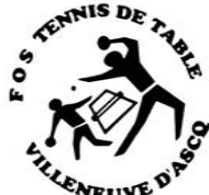
Tableau A (plus de 40 ans)