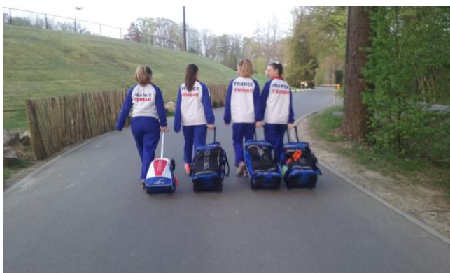
De bon matin, en route pour disputer les ½ finales.

L'enjeu de ces épreuves revêt une importance toute particulière cette année car nos 3 joueuses prétendent à la sélection en équipe de France pour les championnats d'Europe Jeunes en Roumanie au mois de juillet prochain.