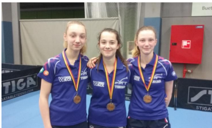
Nos 3 joueuses médaillées.

Cet Open de Belgique est un RV incontournable du calendrier international des jeunes. Il précède cette année d'une semaine l'Open de France qui se déroulera du 27 au 29 avril.